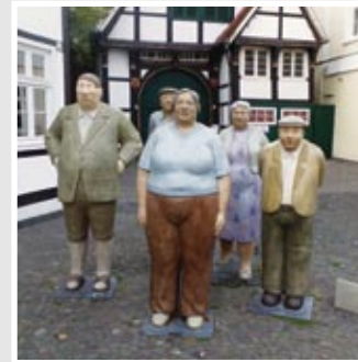
FOTOGROPPE, Lange Straße