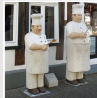
KOCHDUELL, Lange Straße