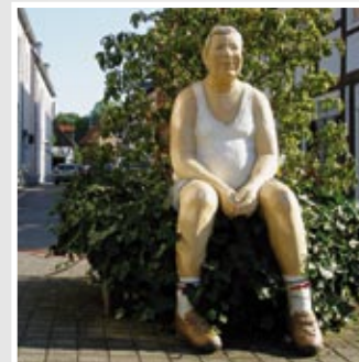
WIEDENBRÜCKER ORIGINAL, Kirchstraße